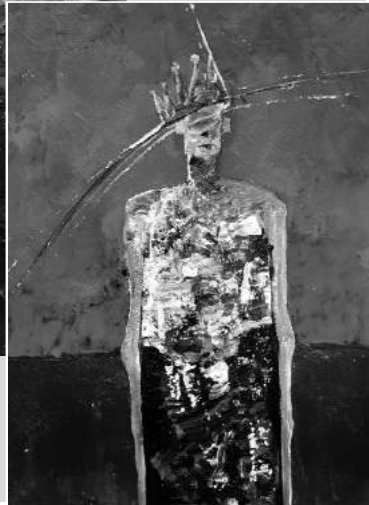
William Shakespeare. Richard al III-lea (acrilic pe pânză, 2020)