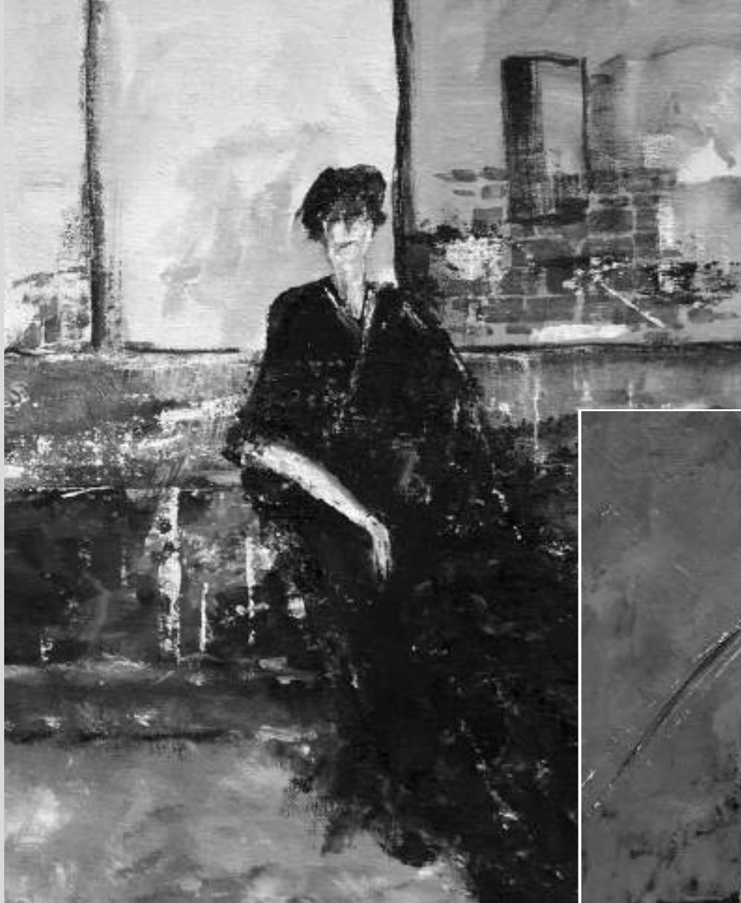
G.B. Shaw. Profesiunea Doamnei Warren (acrilic pe pânză, 2020)