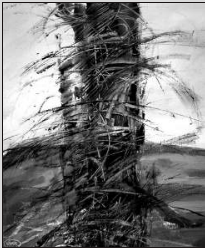
Arborele cosmic (acrilic pe pânză, 1993)