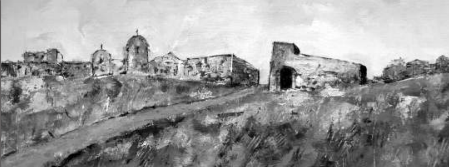
Orașul de pe colină (acrilic pe pânză, 2020)